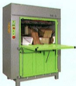
DIXI 18 S Spinta 18 t Peso balla 140-220 kg