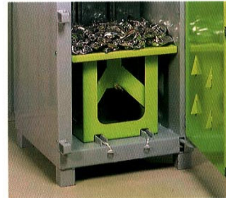
Supporto per lo schiacciamento delle latte