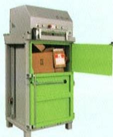
DIXI 5 S-K Spinta 5 t Peso balla 40-60 kg

4 t di spinta pressa idraulica compatta ed economica