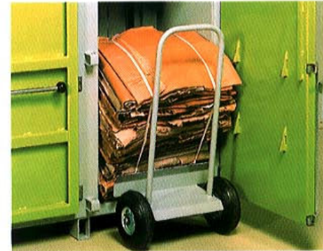
Carrellino per estrazione e movimentazione delle balle