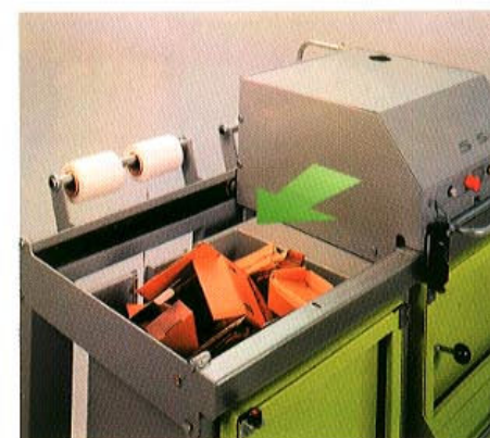
Camere multiple (optional)