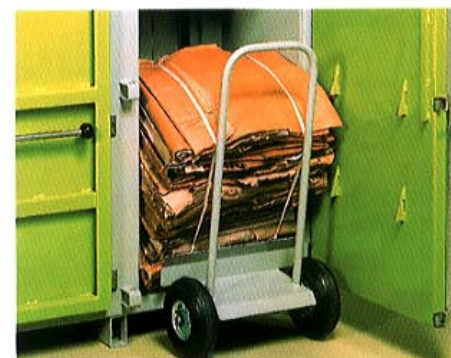
Carrellino per estrazione e movimentazione delle balle