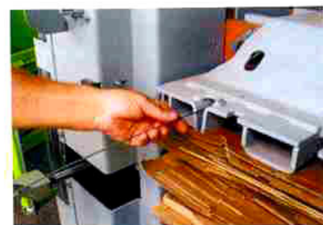
Facile legatura con filo di ferro tipo "Quick link"