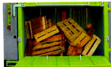
Non ci sono problemi nell'imballaggio di materiali particolari, quali cassette di legno o plastica per la frutta