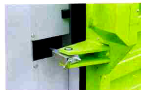
Meccanismo idraulico per l'apertura del portellone, per evitare aperture violente